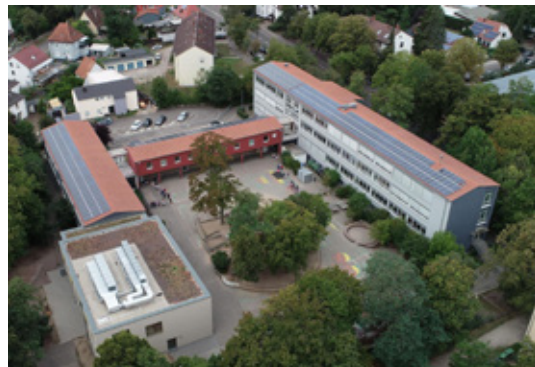
Die Eduard-Orth-Grundschule in der Stadt Germersheim.

Auch in der Stadt Germersheim strapazieren die hohen Heizkosten die öffentlichen Gebäude. Nach den Ergebnissen der vorgelagerten Untersuchung bevorzugten die Verantwortlichen eindeutig eine Funklösung mit Heizkörperthermostaten. In der Recherche hob sich die DEOS Lösung hervor: Batterielos (spart laufende Servicekosten), LoRaWAN Funkprotokoll (für besten Empfang in allen Gebäudeteilen) und schneller Installation (im laufenden Gebäudebetrieb).