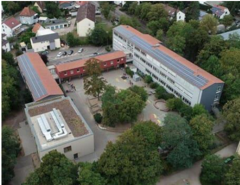
Die Eduard-Orth-Grundschule in der Stadt Germersheim.

Mit etwas über 20.000 Einwohnern liegt die Kreisstadt Germersheim (Rheinland-Pfalz) nahe an Baden und dem Elsass. Um eine rasche und rentable Lösung zur Reduzierung der Heizkosten im Schulgebäude zu finden, wurde eine herstellernerneutrale Vergleichsrechnung durchgeführt. Diese ergab, dass die einmalige Investition in Funk-Heizkörperthermostate um 13 % günstiger ist als die vergleichbare kabelgebundene KNX-/DDC-Raumlösung.