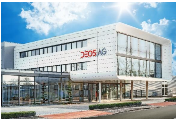
Abbildung 1: Zentrale der DEOS AG in Rheine