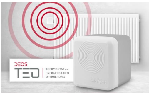
Abbildung 2: Einfache Nachrüstungen und mit dem DEOS Funkthermostat bis zu 40% Heizkosten sparen