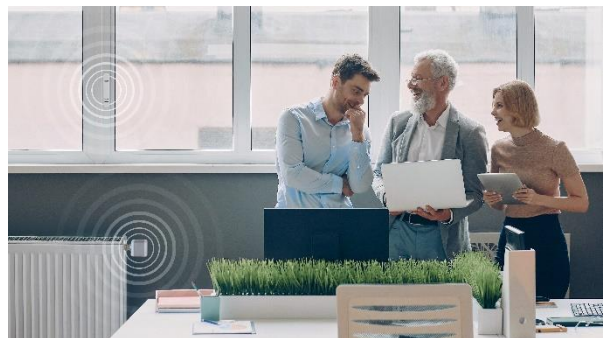
Abbildung 3: DEOS Raumlösung – batterie- und kabellos mit DEOS TEO Heizungsthermostat