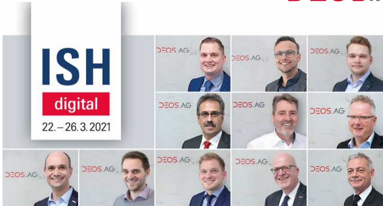
11-köpfiges DEOS Messteam