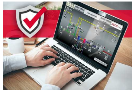
DEOS Anlagenbild zur Fernwartung