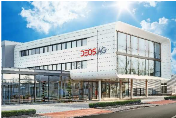
Zentrale der DEOS AG in Rheine