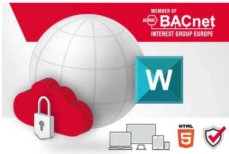
Newsbild Vorteile der DEOS Cloud