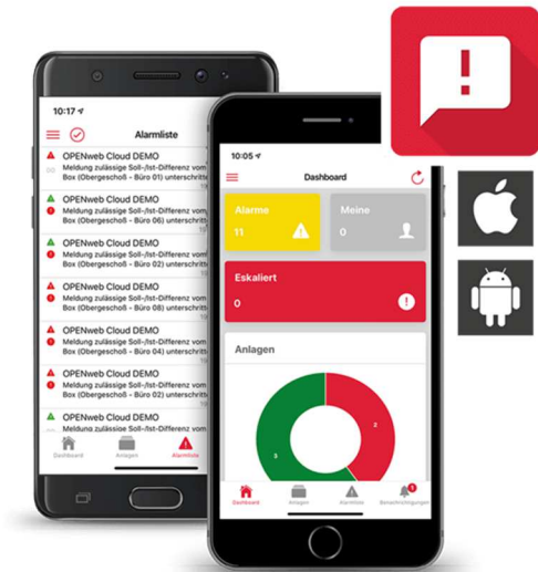
DEOS Secure AlarmApp