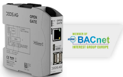
DEOS Meldegateway OPEN GATE