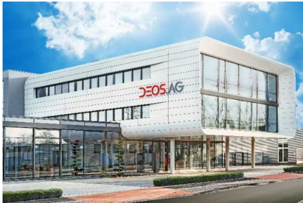
Zentrale der DEOS AG in Rheine