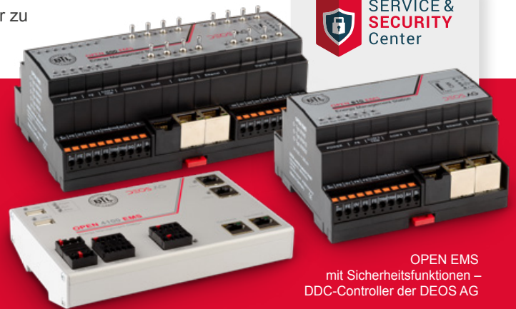
OPEN EMS mit Sicherheitsfunktionen – DDC-Controller der DEOS AG