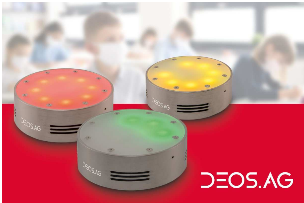
DEOS Raumluftampel SAM