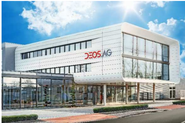
Zentrale der DEOS AG in Rheine