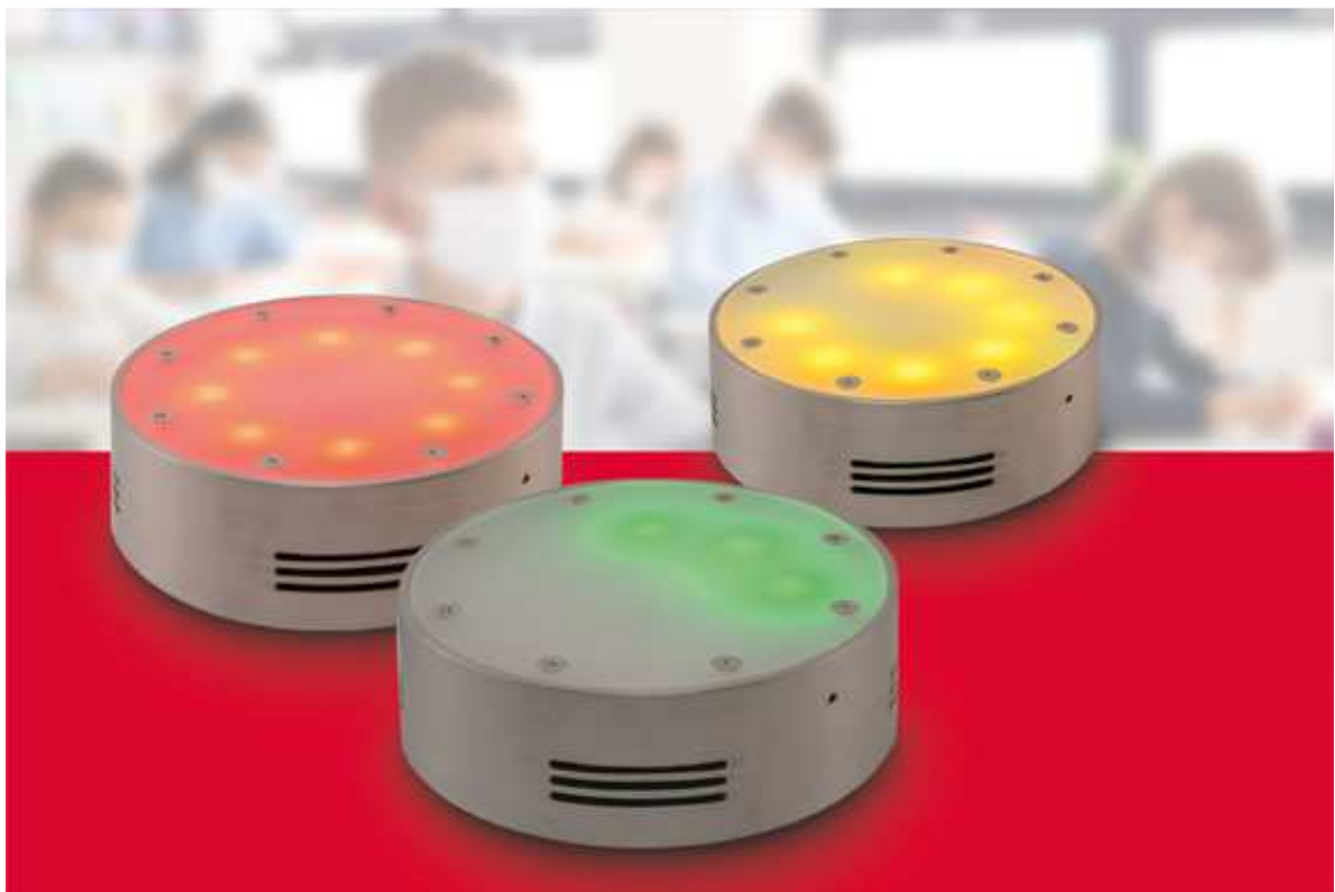
DEOS Raumluftampel SAM