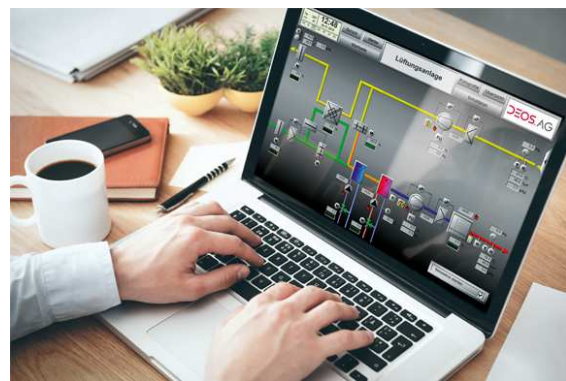
DEOS Anlagenbild zur Fernwartung