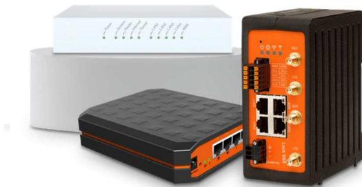
DEOS Connect Boxen