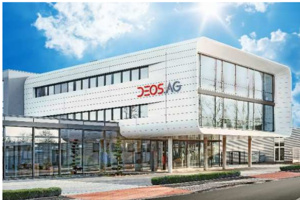
Zentrale der DEOS AG in Rheine