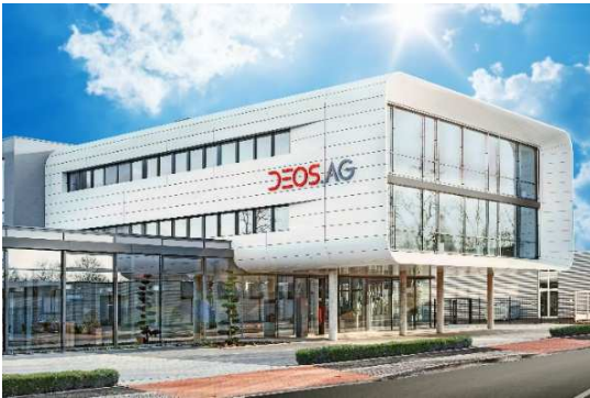
Zentrale der DEOS AG in Rheine