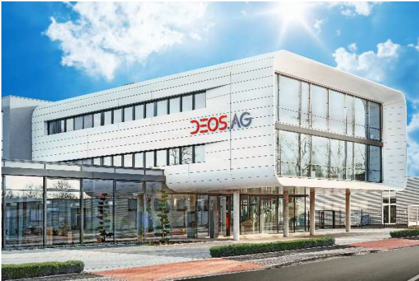
Zentrale der DEOS AG in Rheine