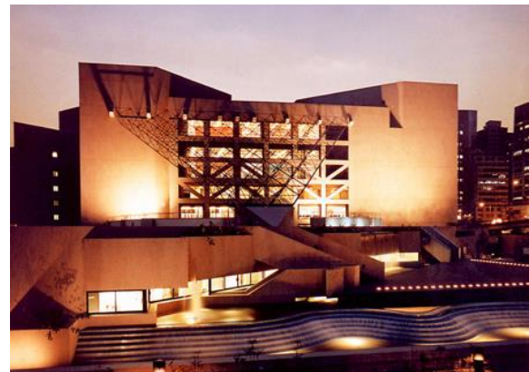
DEOS Referenz: Hong Kong Academy for Performing Arts