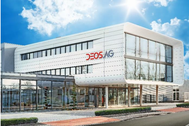
Zentrale der DEOS AG in Rheine